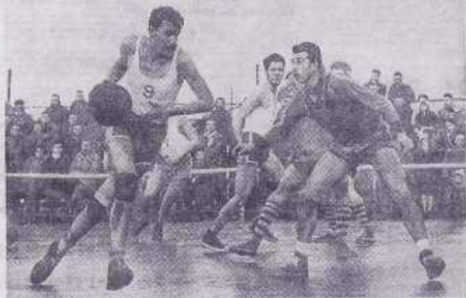
Handais ne pourra stopper Chiffo dorf le début de match fut excellent. Terzet, l'un des plus solides joueurs tourangeaux et Pascal F. La Wolpe montent, aux côtés, à l'attaque.

La Martiale, malgré son courage, s'est inclinée de 22 points : 63-41